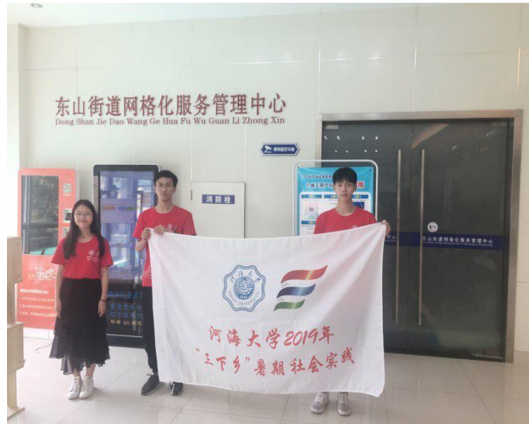
实践团在江宁区东山街道网格办进行调研

7月9日,实践团前往江苏省常州市河海街道开展实践调研活动。团队成员前往兰翔社区就网格化管理模式对社区居民展开调查,发放并回收调查问卷,对居民知情程度以及参与意愿有了初步认知。调查发现目前居民对网格化模式的了解程度并不高,随后,团队前往居民委员会对相关工作人员进行采访,完善了对网格化治理流程、组织架构的认识,进一步掌握了常州市新北区河海街道网格化社会治理运行情况。最后,团队在社区工作人员的建议下前往河海街道网格化社会治理办公室对工作人员进行采访,从网格员选拔与监督、模式的具体运行、奖惩机制等方面入手,对网格化社会治理模式有了更全面的认识。