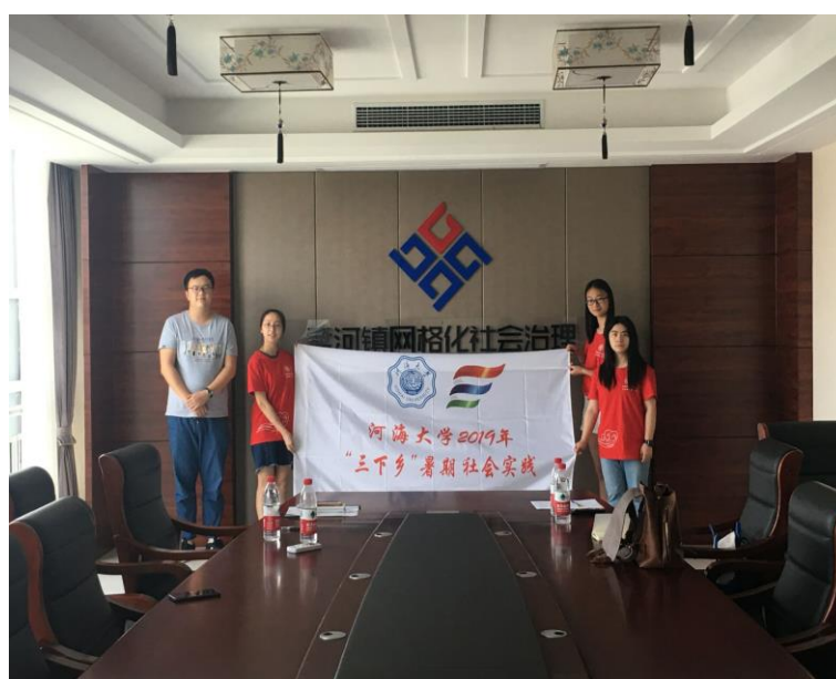
实践团在孟河镇网格化社会治理联动指挥中心调研

7月11日，实践团三名成员前去孟河镇网格化社会治理联动指挥中心展开了关于乡镇网格化治理现状的调查研究。工作人员介绍了如何运用网格化模式对下属乡镇进行管理，还对网格的划分标准、网格员的选拔方式、网格员和网格长相关监督政策和奖惩措施进行了介绍。另外实践团还参观了联动指挥中心的工作环境，先进的机器设备在管理网格员、网格长和处理事务等方面都起到了巨大的促进作用。