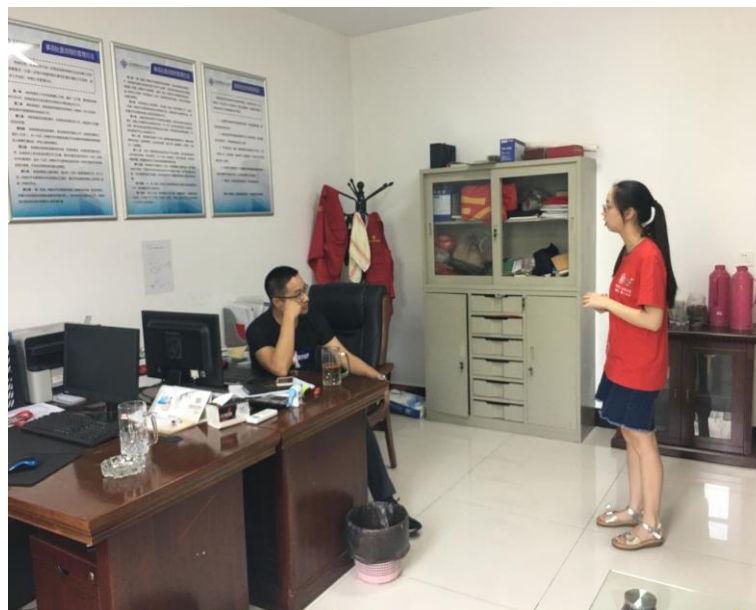
张主任向团队成员们介绍自己的工作情况

7月12日，实践团前往江苏省常州市新北区孟河镇齐梁社区开展实践调研活动。在齐梁社区党员群众服务中心，兼职网格员的社区张主任接待了实践团队，张主任向团队成员们介绍了他自身作为一名网格员的职责。团队成员了解到，张主任作为网格员主要负责齐梁社区内的两个安置小区，日常处理的事件较为琐碎，例如居民私自破坏绿化带、私自占用盲道以及违规充电等等。作为网格员，张主任自行处理力所能及的事件，将不能处理的事件按照网格员-村-镇-区-市的机制逐级上报，从而调用相关的职能部门对相关事件进行处理。此外，张主任鼓励更多人关注网格化管理并对此提出更多的建议，从而推动网格化管理的实施和应用。