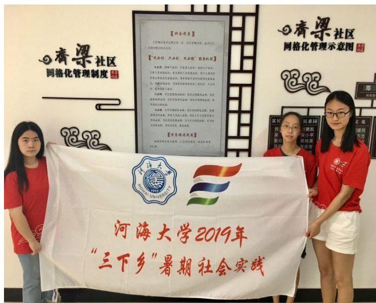
实践团在常州市河海街道开展实践调研

7月11日，实践团三名成员前去孟河镇网格化社会治理联动指挥中心展开了关于乡镇网格化治理现状的调查研究。工作人员介绍了如何运用网格化模式对下属乡镇进行管理，还对网格的划分标准、网格员的选拔方式、网格员和网格长相关监督政策和奖惩措施进行了介绍。另外实践团还参观了联动指挥中心的工作环境，先进的机器设备在管理网格员、网格长和处理事务等方面都起到了巨大的促进作用。