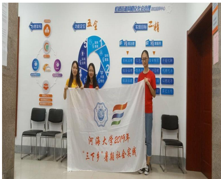
实践团在南通市崇川区虹桥街道街道调研合照

联动指挥中心工作人员接受实践团的访谈，讲述了街道网格化治理的历史进程，并分析了现在的优点和不足之处。最后联动指挥中心工作人员认真填写实践团的调查问卷，提出衷心的建议。