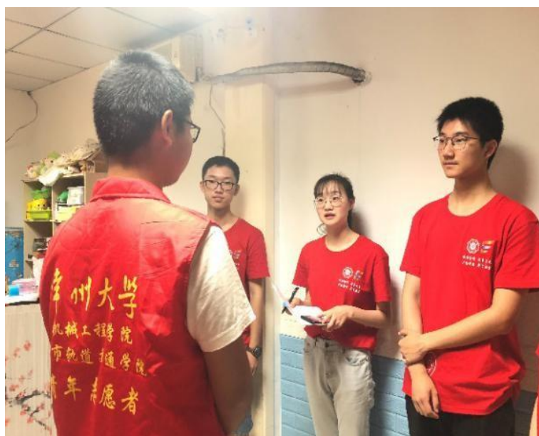
与各个组织的优秀志愿者交流

在调研活动期间，实践团先后走访了天爱儿童康复中心、新北区社会福利中心、天宁区图书馆，并与机构负责人进行了专项沟通。他们都对河海大学的志愿者一直以来提供的志愿服务提出了高度的赞扬，并且对与河海大学建立长期志愿合作关系的模式表达了充分的肯定。此外，实践团还对有望与河海大学建立合作关系的一加爱心社志愿者服务中心进行实地调研。在与负责人进行交流时，实践团队针对该公益组织最迫切的需求、期许学校提供哪种类型的志愿活动等诸多