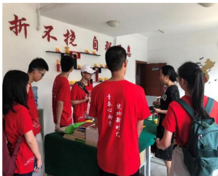
与各个组织的负责人交流