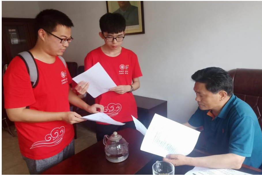
团队成员与陈局长阅读相关资料

7月21日，实践团前往宁武县水利局与水利局陈局长进行交流探讨。针对当地居民对河长制的认知模糊与源头环境污染问题，陈局长表示河长制出台时间较短，全面推行还需要更长的时间，水环境的保护需要相关部门与人民群众共同努力。