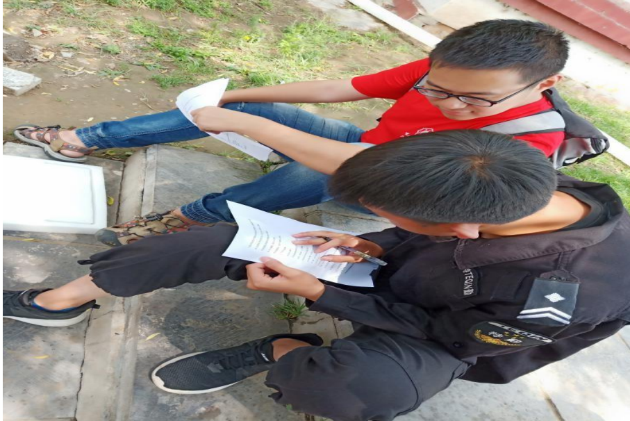
工作人员填写调查问卷

7月18日，实践团前往宁武国家地质公园博物馆了解汾河源头水环境历史变迁。在解说员的讲解下，团队了解到汾河源头的历史演化进程，并对流经地区独特的地理环境、地质特征和丰富的矿产资源有了初步认识。通过观看2007-2017年政府对于汾河源头水环境的保护与治理措施概览视频，团队成员感受到国家以及当地政府对汾河水环境的重视。在全面的河流治理后，汾河源头水质又重回“汾河流水哗啦啦，阳春三月看杏花”的佳态。随后，实践团前往忻州市驻宁武县水文观测站。通过询问汾河源头水质水量的动态监测情况以及倾听监测工作人员的专业讲解，实践团进一步了解到在政策的支持下汾河水水质得以不断的改善。