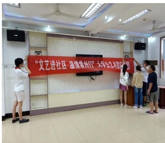
实践团成员布置会场

场的布置工作，在老人们陆续到场之后，实践团成员来到老人身边亲切地问候他们的近况。9点30分演出正式开始，在主持人的介绍下，一个个精彩的节目纷纷呈现。舞队同学带来了维族风情舞蹈《青春舞曲》、古典舞蹈《知否知否》和古典舞身韵组合《小池》等，电声乐队和管弦乐队也带来了他们擅长的小提琴和吉他表演。演出最后，所有实践团的成员共同合唱《感恩的心》和《我和我的祖国》作为结束曲并和老人们合影留念。此次活动也得到了老人们和康复中心工作人员的高度认可，他们认为实践团用实际行动弘扬优秀传统文化艺术的行为值得推广，他们鼓励实践团继续努力，用艺术点亮青春、用艺术装点人生，让高雅艺术走进千家万户。