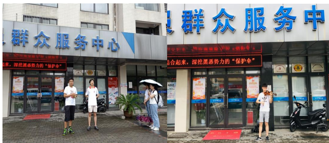
管弦乐队同学小号表演和小提琴独奏

党员群众活动中心门口，首先管弦乐队同学和电声乐队同学分别带来了《北国之春》《我和我的祖国》小号独奏、《卡农》小提琴独奏、小合唱、《成都》吉他弹唱等多种大众喜闻乐见的文艺节目。同时，舞蹈队的姑娘们也准备了丰富多彩的舞蹈，包括充满异域风情的新疆舞《花儿为什么这样红》、温婉柔美的古风舞《小城故事》等等。表演结束后，实践团与在场的社区居民进行了亲切地交谈，在与他们的谈话中，实践团成员对“你最喜爱的文艺形式”进行了走访调查，了解当下大众对文艺活动的接受程度和建议。