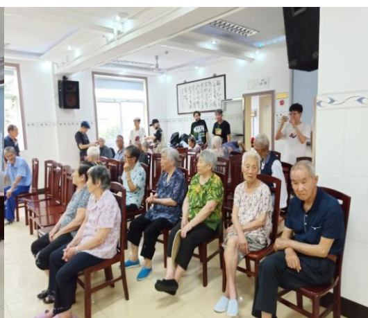
康复中心的老人观看演出