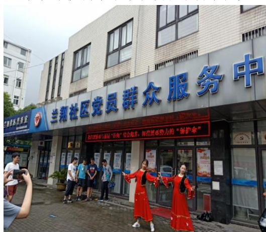
舞蹈队同学新疆舞表演

7月23日早上8点，实践团一行前往新北区社会福利中心的天禄康复中心开展慰问演出活动。来到活动中心，成员们首先开始了会