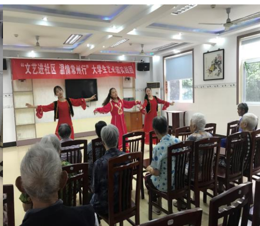
《青春舞曲》新疆舞表演