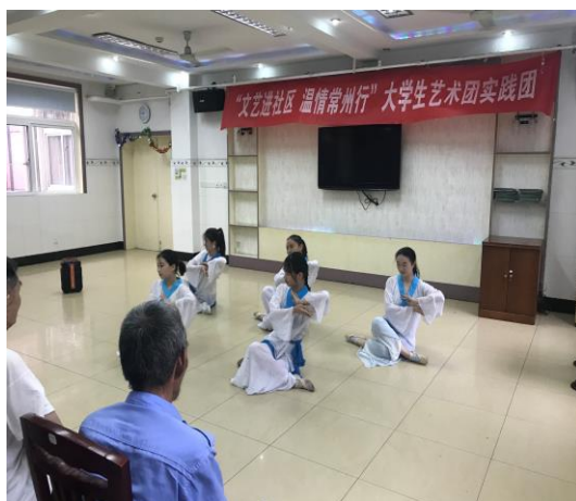
古典舞身韵组合《小池》