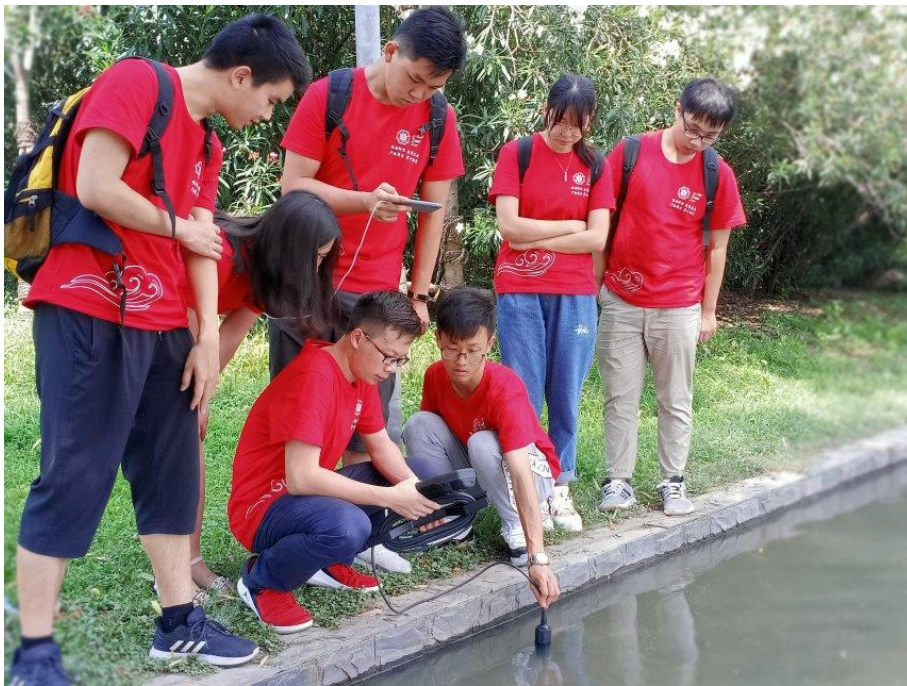
实践团成员检测水质、获取水样

随后实践团成员对不同河段进行了水质调查，对水质进行抽样检测，得到了不同河段水质情况，为后续实践报告提供了充分而又详细的数据。