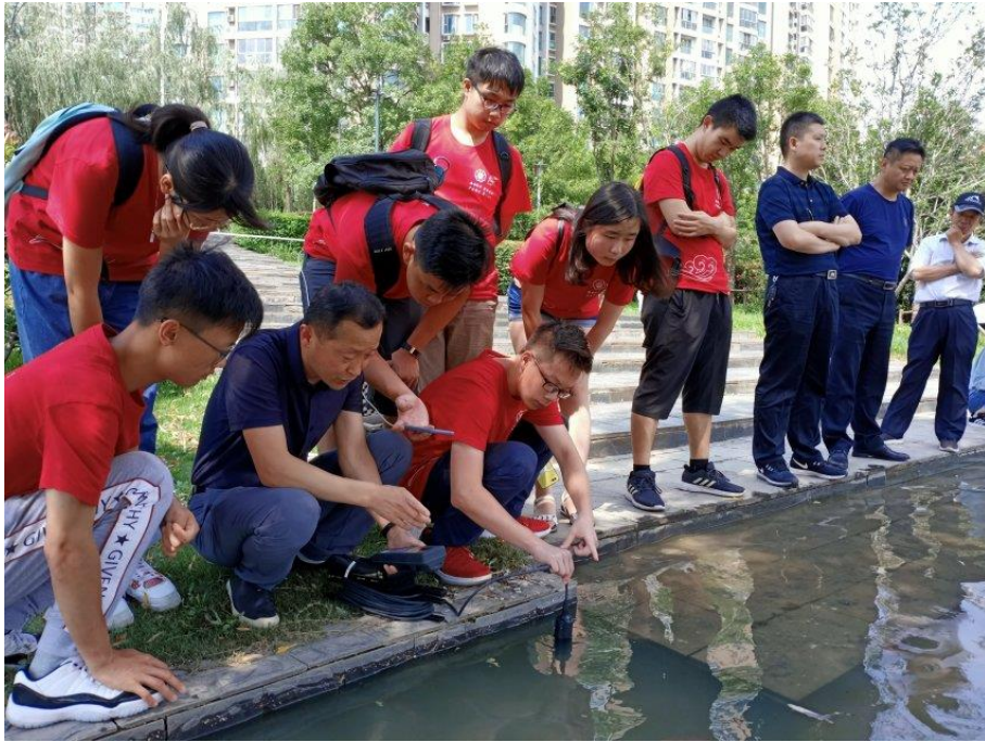
张科长使用便携式水质测量仪向成员们示范如何使用仪器进行水质监测